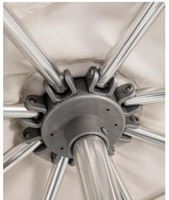
Baleines tubulaires \varnothing 19 mm Épaisseur 1,2 mm