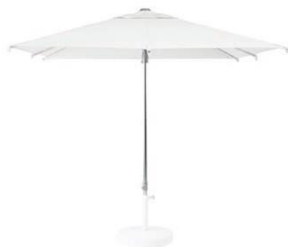
Blanc Q8 403 096

Les mesures indiquées sont des valeurs moyennes et peuvent légèrement varier sur le produit