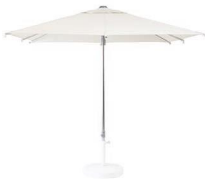
Beige Q8 403 003