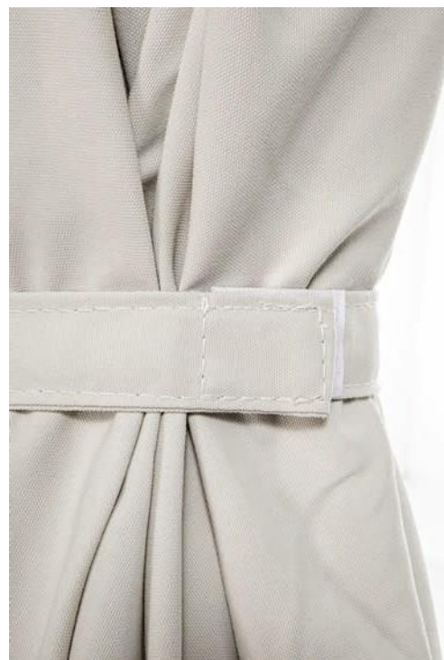
Fermeture toile par scratch