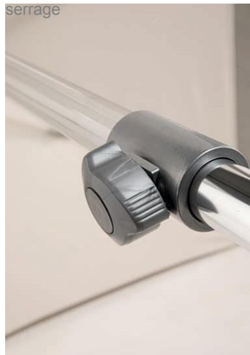
Mât 2 parties – molette de serrage