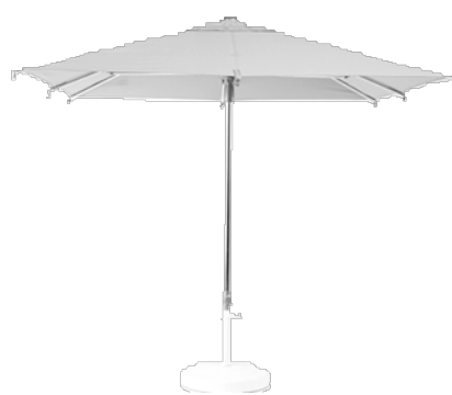
Gris Q8 403 235