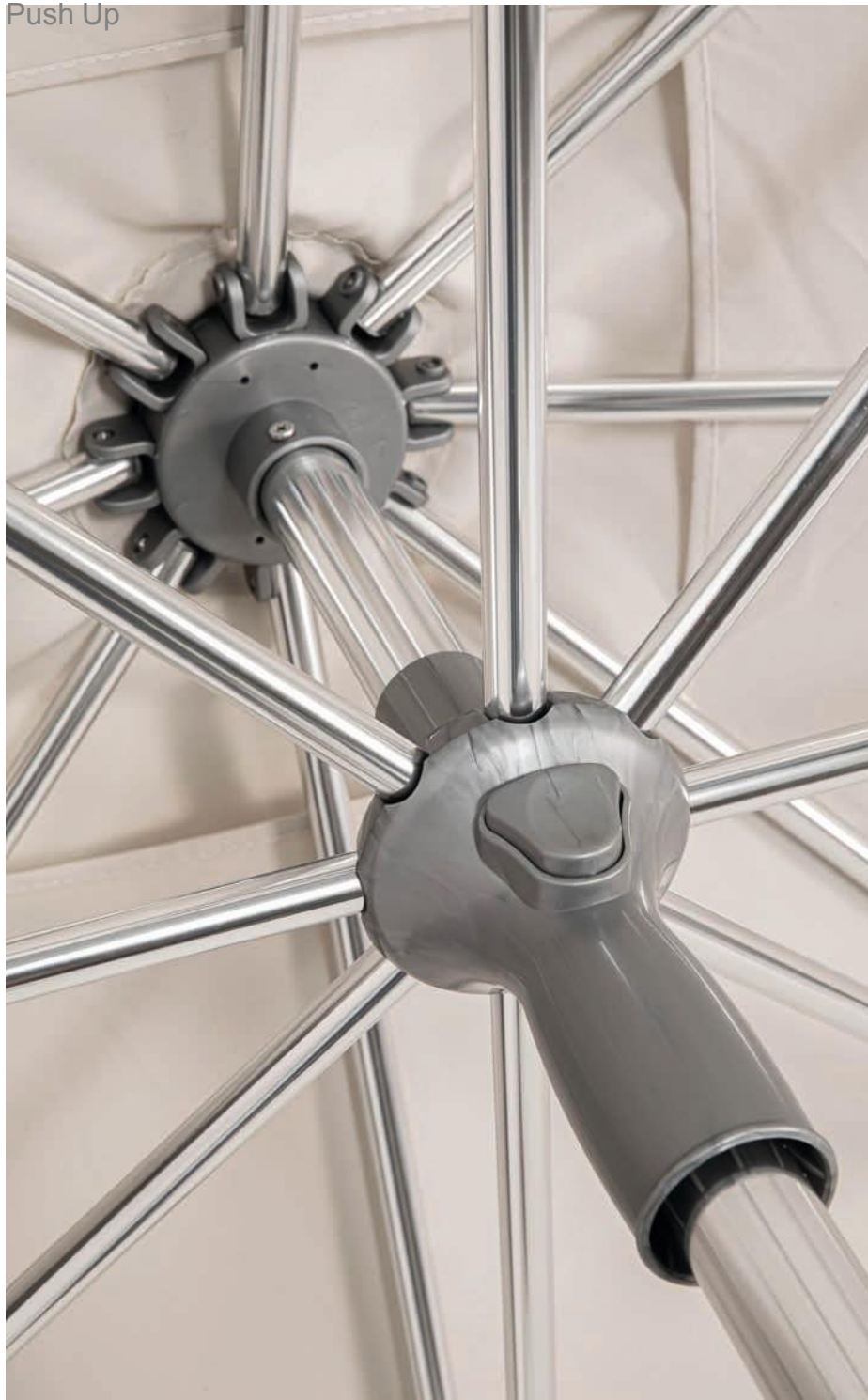
Mât inférieur ø 35 mm Épaisseur 1,4 mm