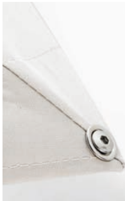
Vis et accessoires inoxydables