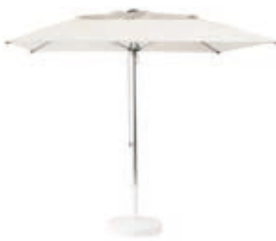
Beige U4 501 003