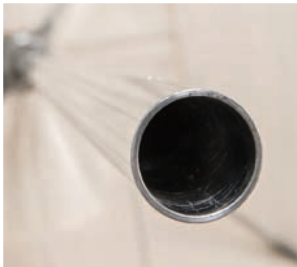
Mât central aluminium anodisé \varnothing 38 mm. Épaisseur tube 2,5 mm