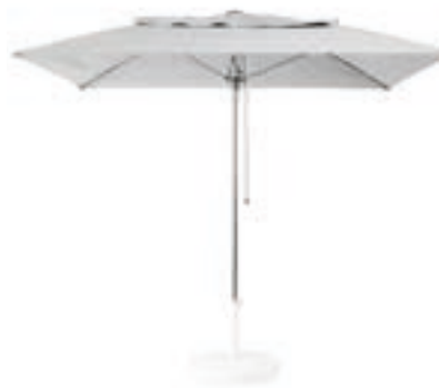
Gris U4 501 235