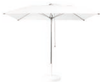
Blanc U4 501 096

Les mesures indiquées sont des valeurs moyennes et peuvent légèrement varier sur le produit