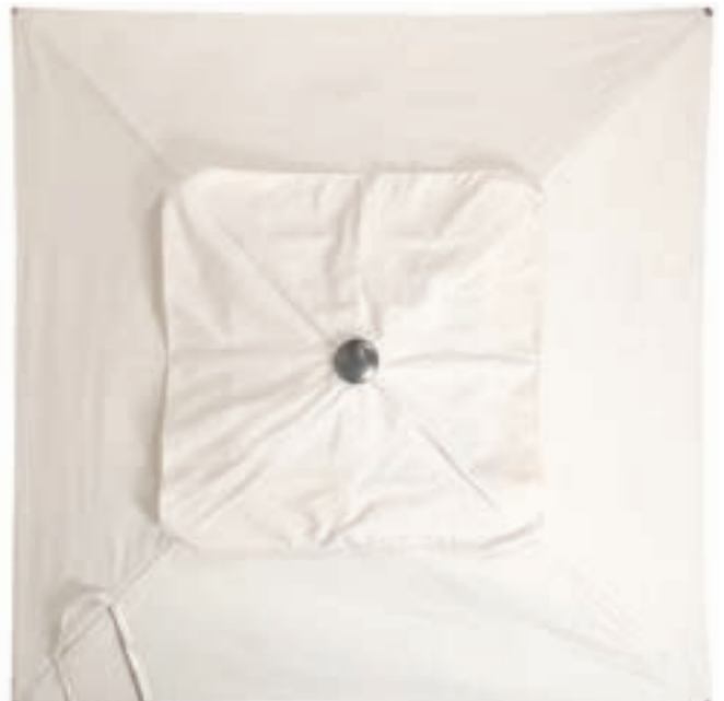
Cheminée XL - baleines de renfort intégrées