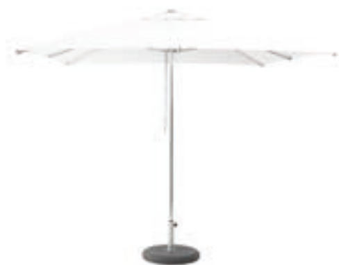
Blanc U4 601 096

Les mesures indiquées sont des valeurs moyennes et peuvent légèrement varier sur le produit