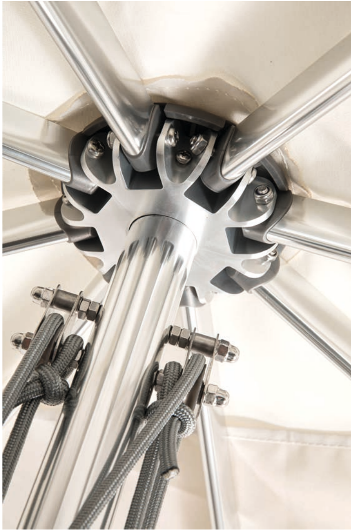
Système double poulie Easyglide