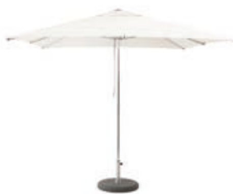
Beige U4 601 003